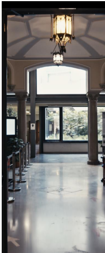
Vita al Tartini