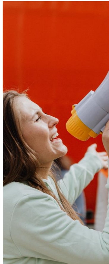
Diritti degli studenti