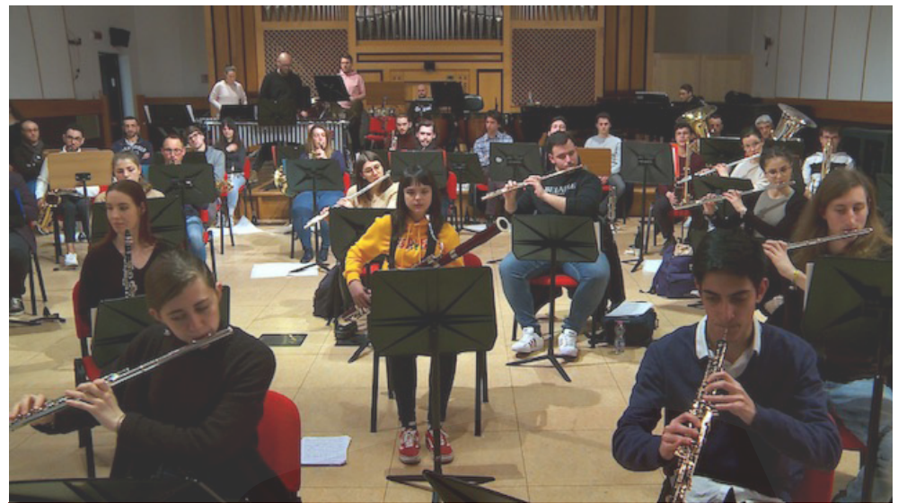
Orchestra di Fiati del Conservatorio di Musica "Tartini"